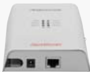
Nätverksuttag i en medieomvandlare*