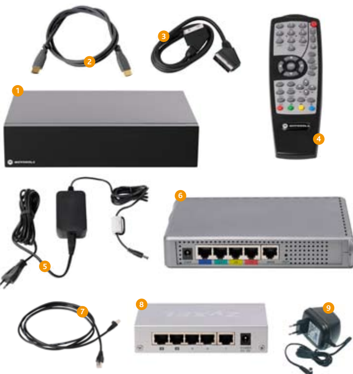
Digitalbox (1), HDMI-kabel (2), scartkabel (3), fjärrkontroll (4), strömadapter (5), bredbandsswitch (6), nätverkskabel (7), tv-switch (8), strömadapter (9).